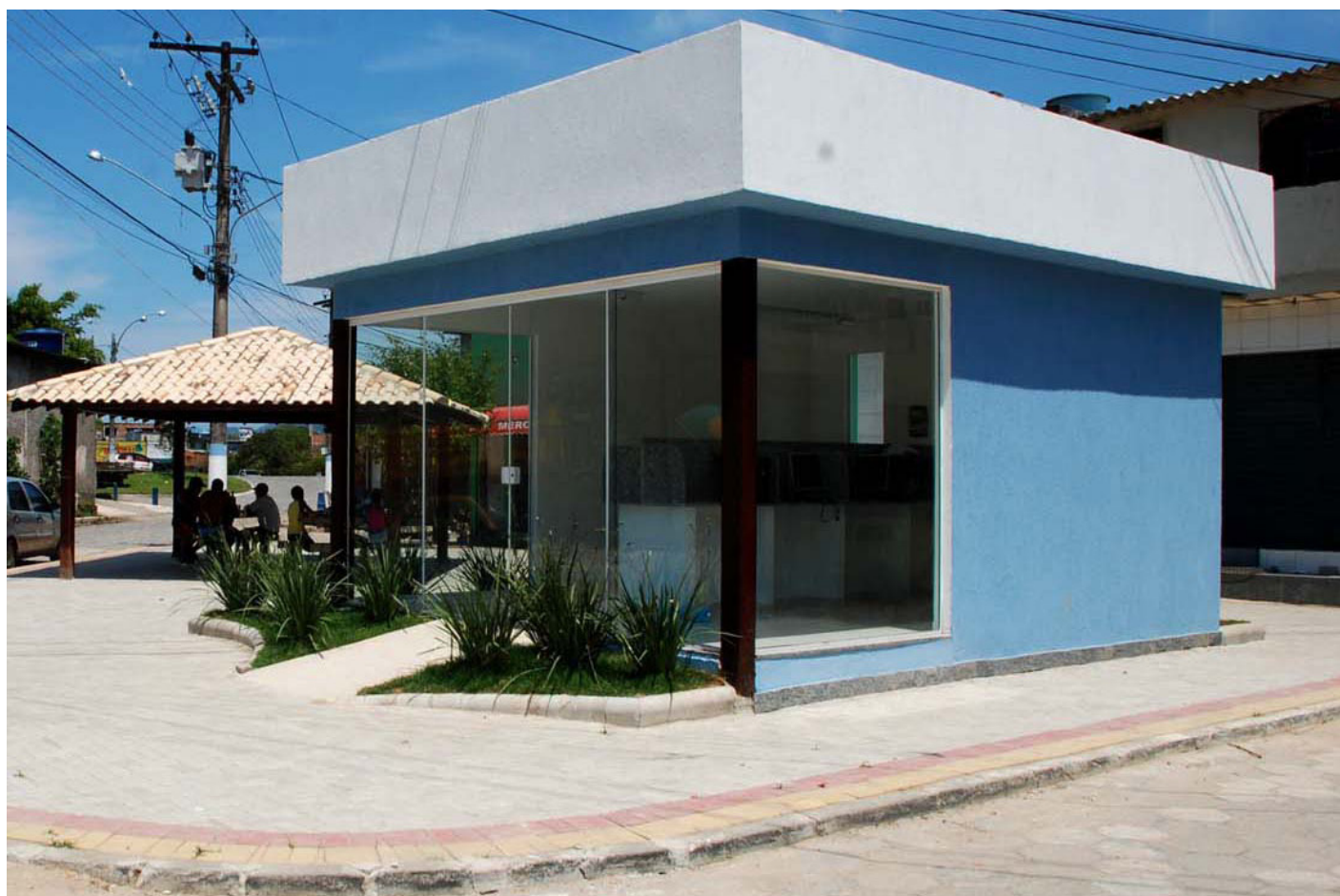
Teleinfos do município oferecerão contato direto com os moradores